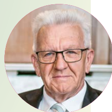
Ministerpräsident Winfried Kretschmann (Schirmherr des Internationalen Bachfests Stuttgart)

»Wir dürfen gespannt sein, was uns an besonderen Darbietungen erwartet. Ich freue mich sehr, Schirmherr des neuen Festivals zu sein, und wünsche den Veranstaltern viel Erfolg!«