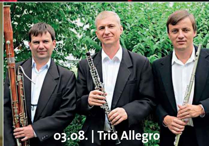
03.08. | Trio Allegro