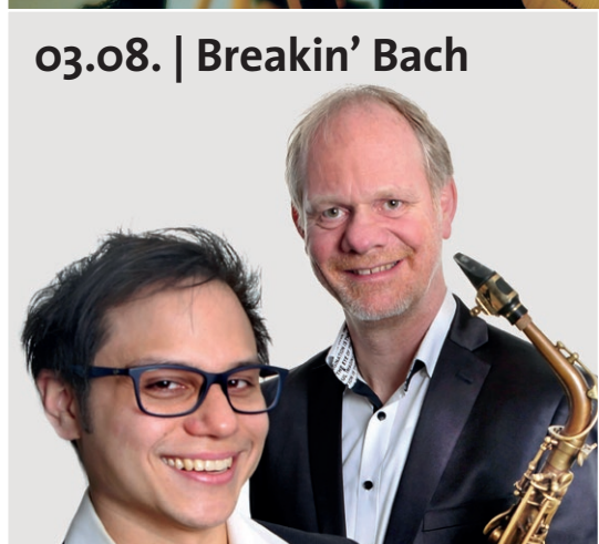
03.08. | Breakin' Bach