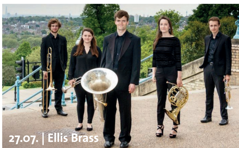
27.07. | Ellis Brass

Die 32. Aschaffenburg Bachtage wollen in der Gegenüberstellung der Werke Bachs und Telemanns deutlich machen, dass Telemann weit mehr ist als ein einfallsloser Vielschreiber, und den vielfältigen Bezügen in Leben und Werk dieser beiden Komponisten nachspüren.