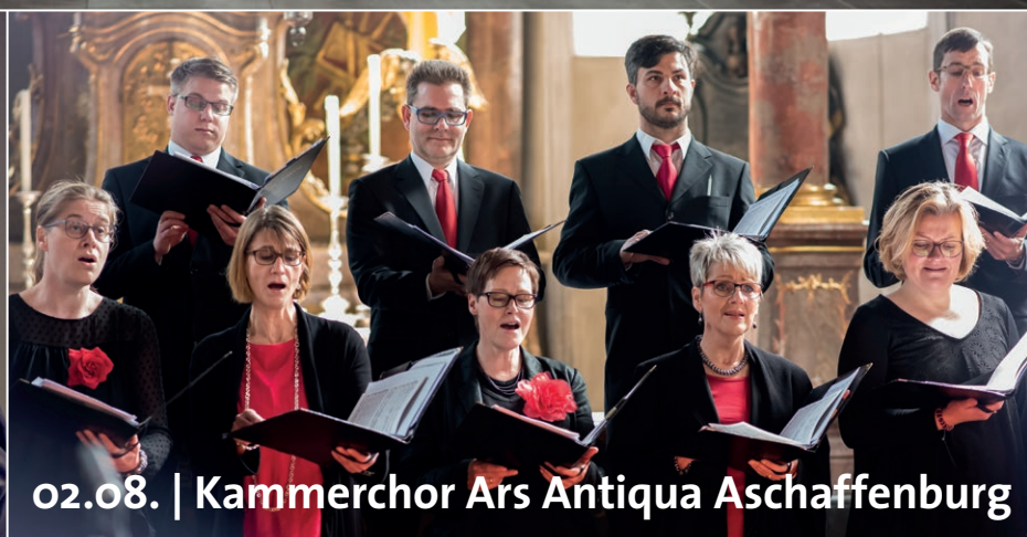
02.08. | Kammerchor Ars Antiqua Aschaffenburg