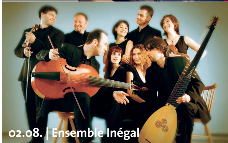
02.08. | Ensemble Inégal