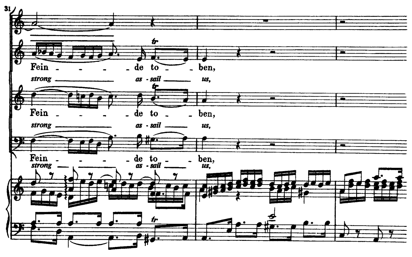
J.S. Bach - Church Cantatas BWV 178