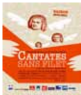
7 Cantates sans filet 2010-2011

Ensuite PASSE TON BACH D'ABORD ! , créé en juin 2008, est un nouveau festival décoiffant : deux jours autour de la musique de Bach, un déferlement d'événements dans des lieux inattendus, insolites et patrimoniaux de Toulouse, au cours desquels la musique baroque est déclinée en version jazz, cirque, flamenco, slam... et aussi baroque ! Un événement à la portée des mélomanes et des curieux, toutes générations confondues, et un succès public impressionnant !