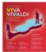
1 Tournée 8 concerts / 8 départements