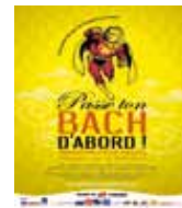
Passe ton BACH d'abord ! 11 et 12 juin 2011